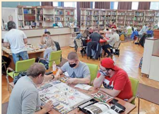
Az első alkalom óta nagyjából 220 ember fordult meg a Gémeskútnál

A Gémeskút – Társasjáték Klub Miskolc nagyjából 160 regisztrált tagot számlál jelenleg.