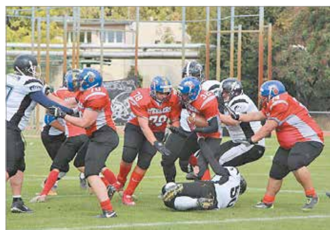
Április elején indulhat a bajnokság