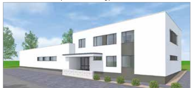
Ilyen lehet a Miskolci Judo Club megújuló épülete