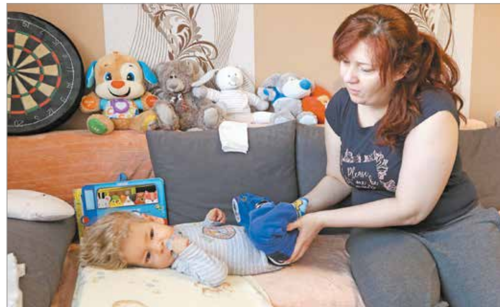
A család bizakodó, pozitívan tekintenek a jövőbe.