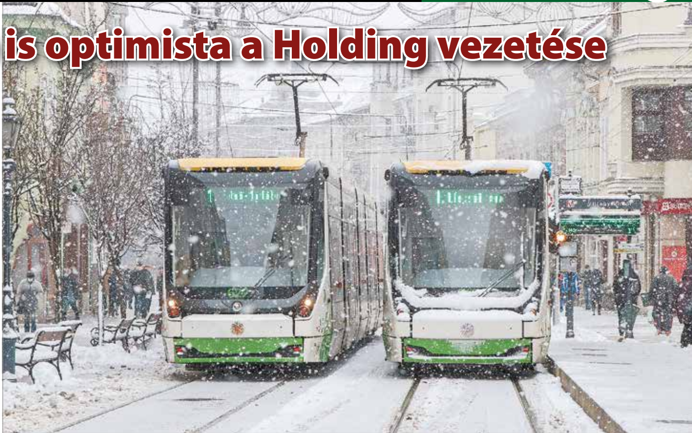
A járvány miatt Miskolcon is csökkentek az MVK bevételei, a hiányt az önkormányzatnak kellett finanszírozni.

Az igazgatóság elnökhelyettese az átalakítást indokolva kiemelte, a Miskolc Holding Zrt.-t annak idején a Debreceni Vagyonkezelő működési elveinek megfelelően alakították ki, amely a mai napig is a már említett menedzsment-szervezetként működik. „A civisváros eredményei alapján úgy gondolom, normális igény, hogy mi is ebbe az irányba szeretnénk visszatelelni a Holdingot. Tavaly több