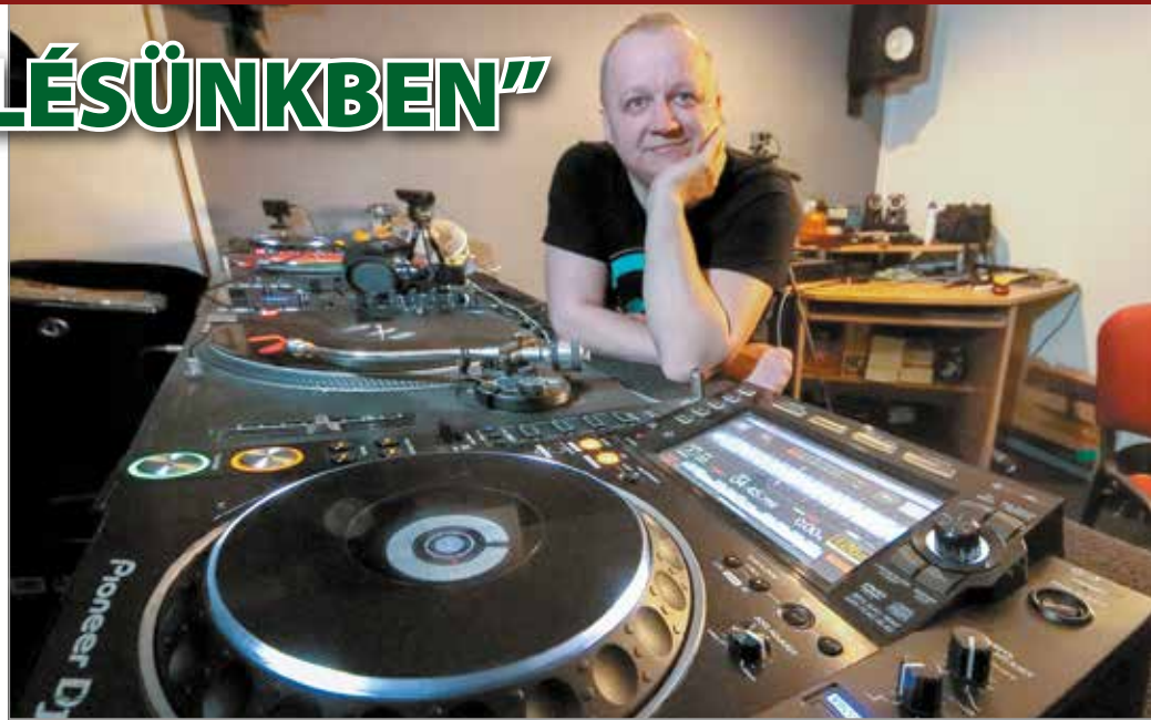
„Szeretném önmagamot adni a lehető legkevesebb kompromisszummal”

Kanyarodjunk el egy picit a zenétől, bár a rádiós karrier nem független ettől. 19 évesen jelentkezett az akkor induló Rádió Topba. Akkoriban a rádiós DJ is volt adásban, játszhatta kedvenc dalait. – Vittük a saját korongjainkat, zenéltünk, gyakorlatilag bármit, ami a táskánkban volt. Saját bőrünkön tanultuk meg