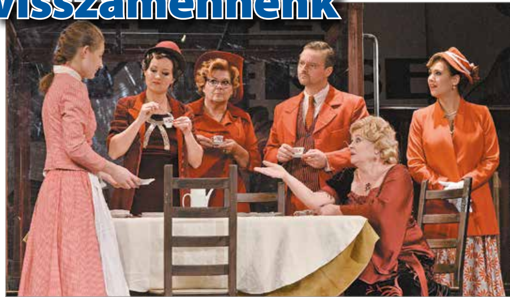
Múlt szombaton az Édes Annát vetítették Rusznyák Gábor rendezésében.

A fejlesztésre azért volt szükség, mert – a tervek szerint – a nyitás után is közvetí-