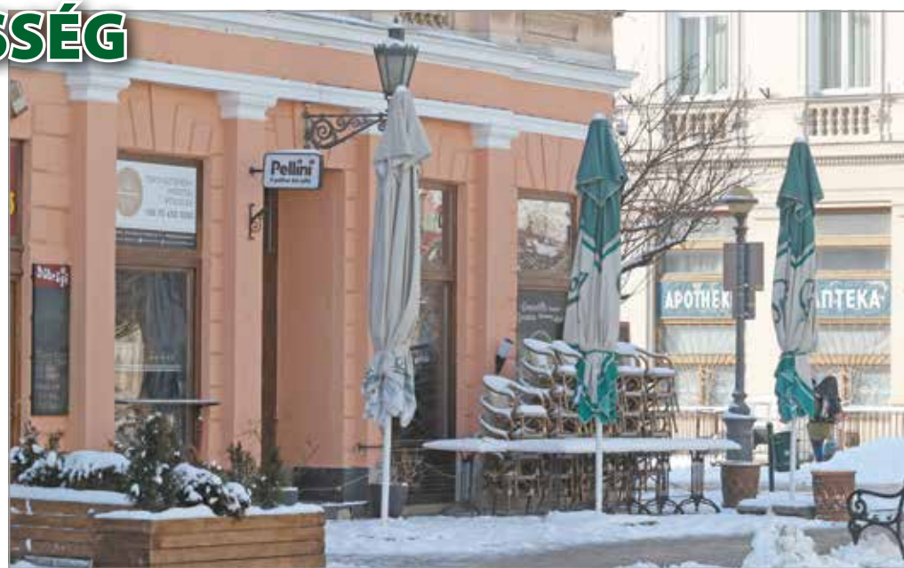
A korlátozások a szolgáltatóipar szinte valamennyi szegmensét érintették.

A kormány most hozott egy intézkedést, aminek (ismét) az önkormányzatok a kárvallottjai, hiszen bevételektől esnek el. Ami részben segítség a vendéglátósoknak, az további bevételkiesést jelent az önkormányzatoknak. Jól illeszkedik abba a sorba, amiben elvonásokkal és más intézkedésekkel a városi büdzsék kiegészítésére, az önkormányzatok kivéreztetésére törekszik. Márpedig a koronavírus-világjárvány tragikus gazdasági hatásai sajnos nem kerültek el őket sem. Miskolcon a pandémia miatti védelmi intézkedések és korlátozások a szolgáltatóipar szinte valamennyi szegmensét érintették, de leg-