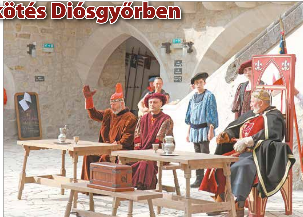
A velencei békekötés ünnepe a Diósgyőri várban.

Nagy Lajos – elősegítő a békét – levélben fordult