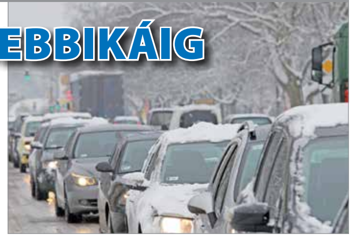
Szerdáról csütörtökre virradó éjjel leesett az idei első, komolyabb mennyiségű hó.

tréfált a kocsin. Ezt persze nem írhatom a számlájára, hiszen nagyjából hatvan napig senki nem volt, aki beindítsa. Ilyenkor jön a sopánkodás, a telefon és a bikakábel. Sohasem baj, ha van ilyen eszköz a kocsinkban, mert bárhol akadhat egy jótét lélek autóstárs, aki segít a bajban, de az olcsóbb, vékony drótos változatot jobb kerülni, vagy kettőt fogni egymás mellé egyszerre. Kapható már a zsebbika is: ez az okos kis szerkezet több nagyáruházban is beszerezhető, és elfér a kesztyűtartóban. Nagyjából ugyanúgy működik, mint a sima, kábeles társa, csak ezt nem kell rákötni