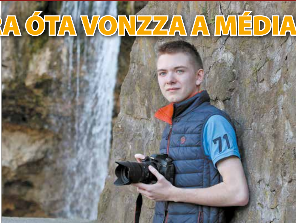
Horváth Csongor rajong Lillafüredért.

– Most gyakorlatilag innen – a gimnázium életének nagyobb részre: istentisztelet, rövid hírek, de tavaly példá-