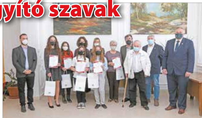
A pályázatot még januárban hirdette meg az önkormányzat.

A járványhelyzet adta lehetőségek mellett, de amennyire lehetett, ünnepélyes körülmények között hirdettek eredményt azon az irodalmi pályázaton, amelyet még januárban, a magyar kultúra napjának apropóján írt ki a miskolci önkormányzat.