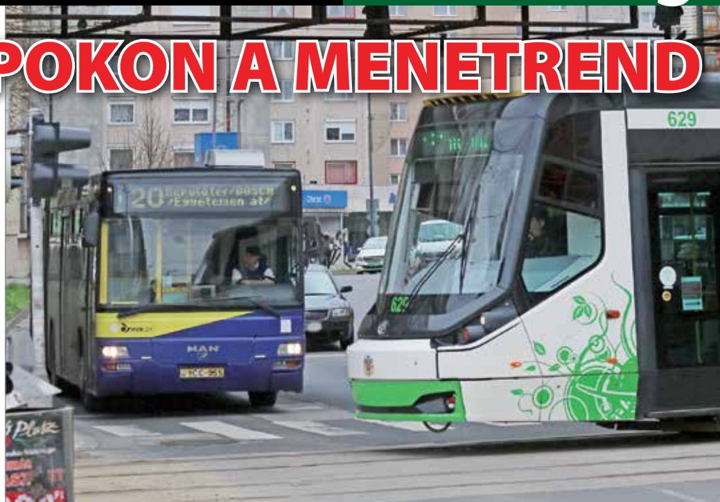
A 2-es és 12-es autóbuszok helyett a 20-assal lehet közlekedni.

Az új érvényes menetrendben tanulmányi időszakban (most szombattól még egyelőre nem ezt, hanem a tanszünetet vezeték be – a szerző) a március 18-ától érvényeshez képest reggel 4