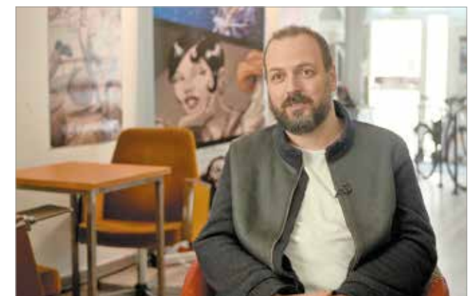
A Volt egyszer egy képregény Gábor Bence dokumentumfilmje a magyar képregénykultúráról

A fesztivált idén szeptember 10-18. között rendezik meg.