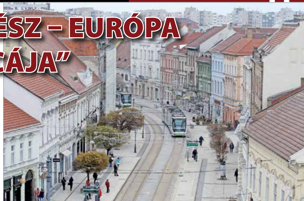
Miskolc főútja Európa leghosszabb, a városban áthaladó főútja.

első német nyelvű levelét, és talán már holnap postára is adhatom. A könyvecske valóban minden kérdésemre megadta a választ, így már a biztos tudás birtokában kezdtem hozzá a levél megírásához. Amint túljutottam a bemutatkozásra, úgy gondoltam, szülővárosomról írok néhány mondatot. A meglepetés akkor ért, amikor rátaláltam arra a fejezetre, ami a legjelentősebb magyar városokról, köztük Miskolcra szólt. Talán nyolc-tíz mondat volt, melyből többek között az is kiderült, hogy Miskolc nemcsak iparáról híres, hanem arról is, hogy itt található Európa leghosszabb főutcája. Már akkor megfogadtam, hogy egyszer majd végigmegyek ezen a hosszú utcán, amiről persze