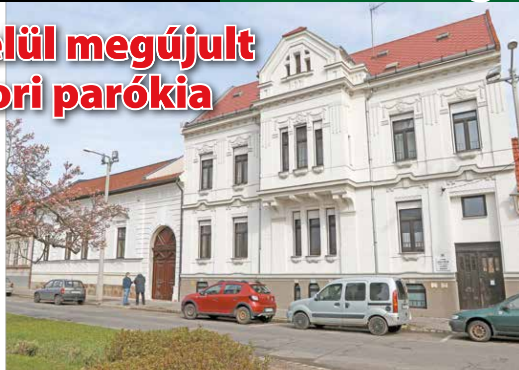
Az épület éke lett a Palóczy utcának.

Megtudjuk, sokáig kérdéses volt az is, hogy a gyülekezet megtartsa-e a valamikori parókiát, végül azonban a bontás helyett a költséges felújítás mellett döntöttek. Mint a lelképásztor mondja, azért, mert nem szerették volna, hogy egy újabb foghíj keletkezzen a történelmi belvárosban. A munkák körülbelül tíz éve tartanak – teszi hozzá –, mindig annyi munkát végeztek el, amennyire forrásuk volt. Azt viszont a lehető legmagasabb minőségben.