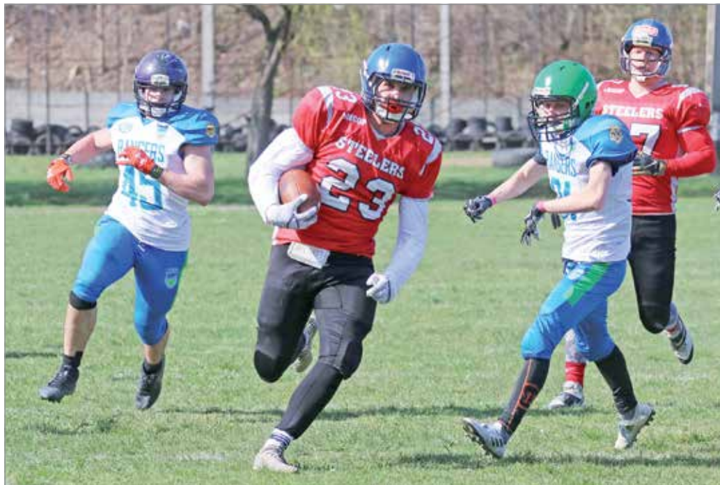
Csak a hátukat nézték.

– A csapat 41 ponttal nyert, így azt hiszem, teljesen nyilvánvaló, hogy sokkal erősebbek voltunk ezen a meccsen – értékelt érdeklődésünkre a Football