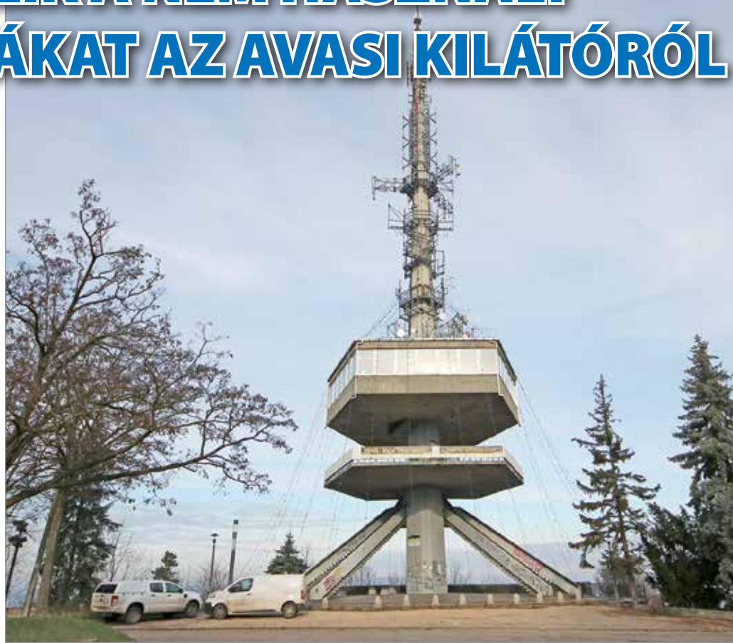
Fontos cél, hogy eltüntessék az antennaerdőt.

Az antennák leszerelése egyébként várhatóan nem sokakat fog felzaklatni: az Avasi kilátó felújításáról szóló hírek alatt rengetegen szorgalmazták, hogy a munkálatok után