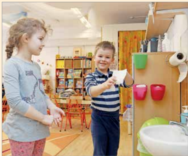
Továbbra is szigorú védelmi intézkedések vannak érvényben.

Azoknak a szülőknek, akik a vírusfertőzéstől tartva az újrainyitást ellenére sem szeretnék óvodába küldeni gyermeküket, az óvodavezető jóváhagyásával erre lehetőségük van, ezt azonban minden esetben jelezniük kell az intézményvezetőnek. Az erre szolgáló nyomtatvány megtalálható az óvodák honlapján.