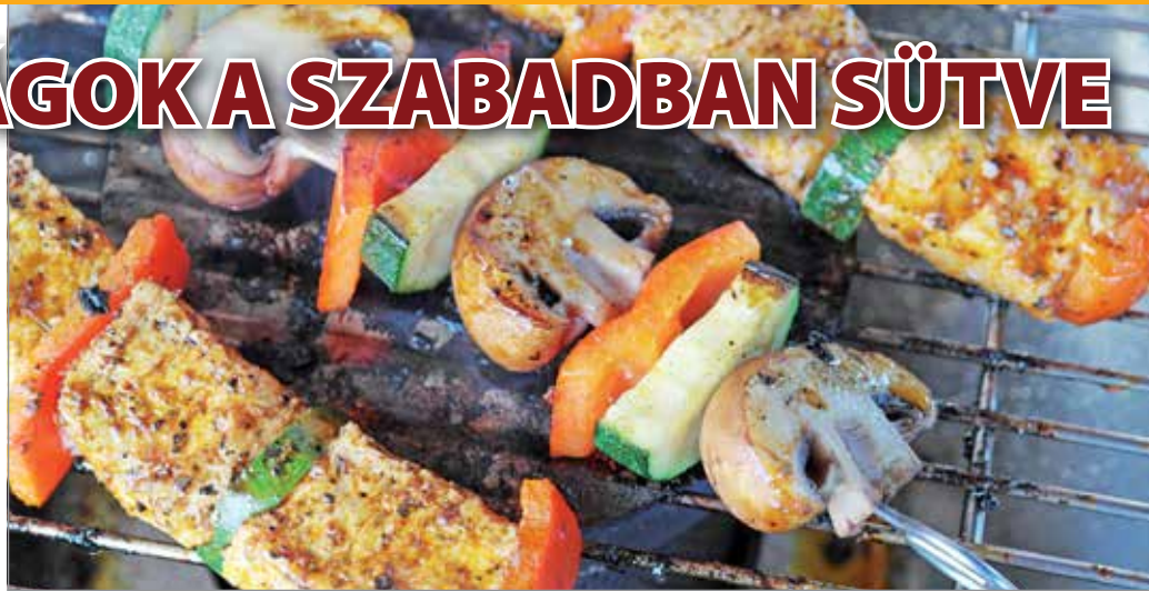
Tűzön, nyárssal számtalan étel elkészíthető.

Tűzön nyárssal számtalan étel elkészíthető. Legtöbbször szalonnát sütünk a mellé tűzött hagymával együtt. – Érdemes héjában hagyni a zöldséget, mert ha kívülről kap egy kérget, amit majd eltávolítunk evés előtt, jobban bezárja a keletkező gőzt, hogy a legbelső hagymadarabka is hamarabb elveszítse csípős ízét, és édeskes, puha legyen. Ízlése válogatja, ki hogyan szereti a szalonnát.