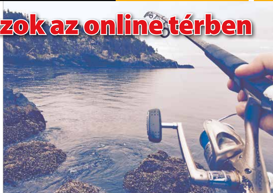
Országosan jelenleg 700 ezer felett van a horgászok száma.

– Óriási felelősség nehezedik tehát a horgászegyesületekre és a horgászokra egyaránt, hiszen Magyarország ivóvízbázisát