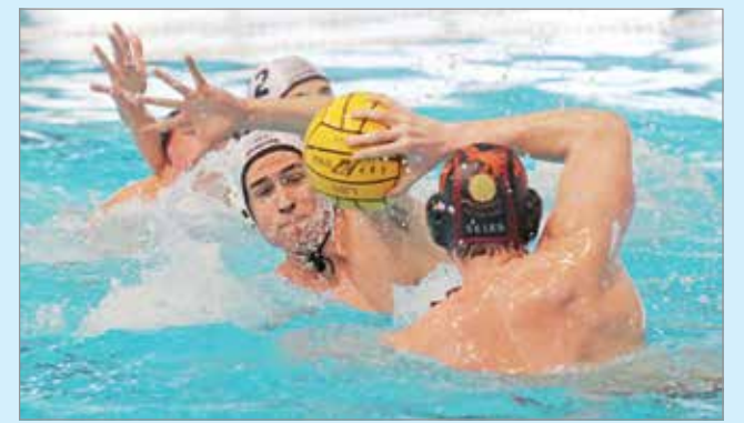
Sokáig állta a sarat a miskolci védelem.

A veresége ellenére is őrizi 9. helyét a bajnokságban a miskolci csapat, de akár előre is léphet, hiszen alig 2 pontra vannak lemaradva az UVSE-től, és április 28-án ahhoz a Szentesehez látogatnak, ami mögöttük van a tabellán. Az alapszakaszt pedig éppen az UVSE ellen zárják pólósaink május 1-jén. Izgalmas találkozók jönnek még.