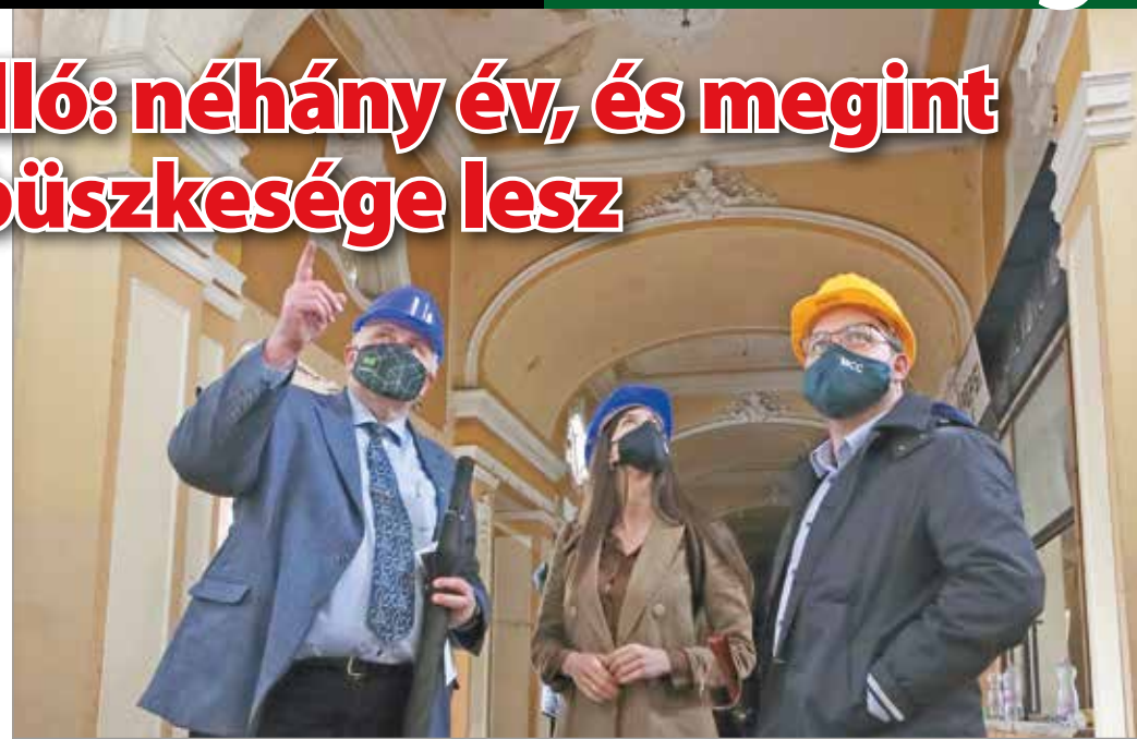
Az ingatlanban kedden tartottak sajtótájékoztatóval egybekötött bejárást.

– Oktatási programjainkkal minden megyei jogú városban, sőt, a határainkon túli magyarlakta területeken is jelen kívánunk lenni. Mint mindenhol, Miskolcon is olyan épületet ke-