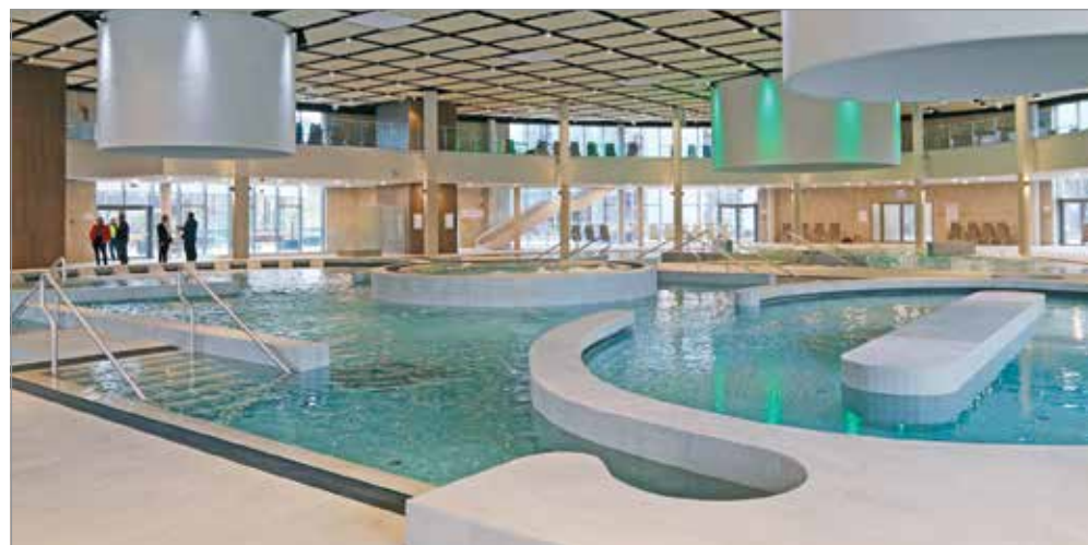
A fürdőzők hamarosan birtokba vehetik az Ellipsum medencéit.

Kérdés esetén a Miskolci Fürdők Kft. kollégái szívesen állnak a vendégek rendelkezésére, személyesen ahelyszínen, telefonon a 46 411 399-es számon vagy az info@selyemretifurdo.hu e-mail-címen.