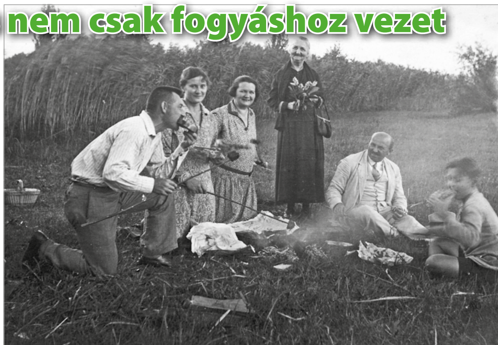
Szalonnasütés 1930-ban.

– Feltűnt, hogy a vonatkozó sajtótermékek szerint leginkább a szegényparaszti rétegeket tudták megszólítani – például a Böszörmény Mozgalom az Alföldön. A sajtóhíradások szerint ezek a szegény parasztsztrók borzasztó-