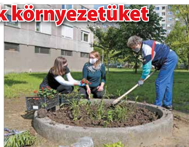
A lakók közösségi kertet is kialakítottak.

Horváth József a cserjék visszavágásában segített. Érdeklődésünkre elmondta, több mint három évtizede lakik a Győri kapuban, de ilyen