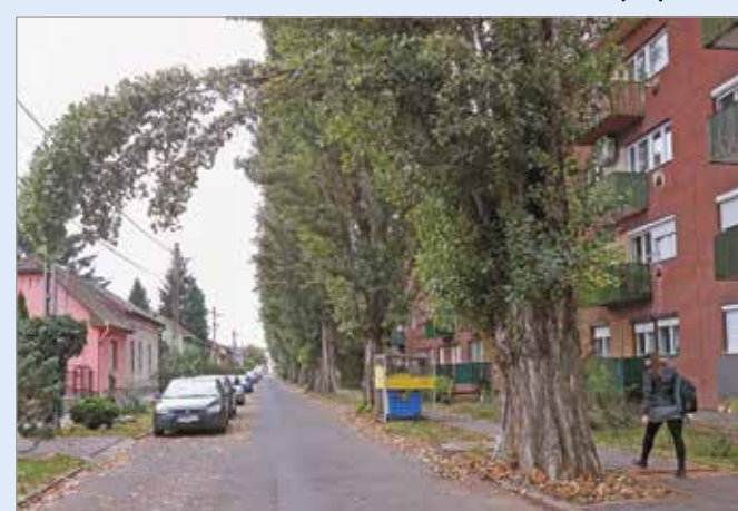
A jegenyefák közvetlenül veszélyeztették az élet- és vagyonszolgálatot.