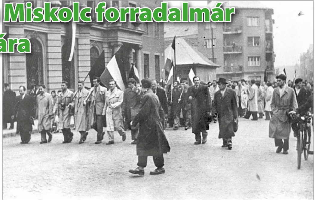
Vonul a tömeg Miskolc utcáin 1956. október 25-én, elől az V. éves egyetemi hallgatók

Itteni élményeit egy kritikus parlamenti beszédében is összefoglalta, az államszocializmus a miskolci iparvidék munkásai számára valójában alacsony életszínvonalat és kiszolgáltatottságot hozott, melyet saját hatáskörében igyekezett enyhíteni. Elítélte a párt hatalmaskodó és erőszakos kiskirályait, a hibák kijavításában bízva már 1956 tavaszán-nyarán sokat tett a helyi értelmiségi reformkörökért, sőt, a közélet demokratizálásáért. Utólag nem is tűnik meglepőnek, hogy október 23-án a