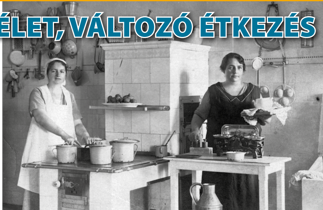
Konyhai életkép 1922-ből.

– A húszas években egyre több lett az irodai dolgozó, akik nem égettek mozgással annyi kalóriát, míg a nagy étvágy, a túlevés továbbra is férfiasnak számított. Később, a gazdasági válság idején ez megváltozik, hiszen már nem