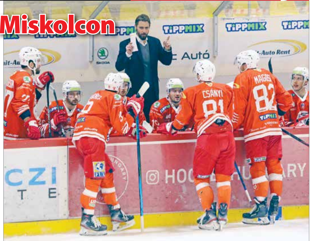
„El kell indulni egy fix irányba”.

– Nekem is az a véleményem, hogy a klubunknak abba az irányba kell továbbmennni, ahol magas szinten lehetőséget biztosítunk fiatal magyar edzőknek – ezt már Egri István, a DVTK Jegesmedvék elnöke mondta. – Viktor több szempontból is megfelelő számunkra: ismeri a ligát, a klubot, dolgozott az