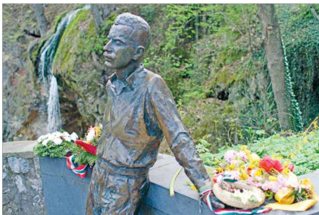
A József Attila-szobor Lillafüreden.