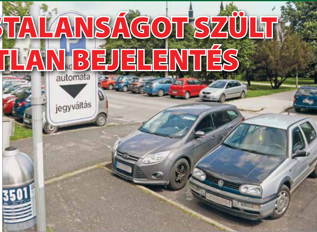
Keddtől ismét fizetés lesz a parkolás.

A kormány bő egy évvel ez előtt, még 2020 áprilisában jelentette be a közterületi parkolási díjak megszüntetését.